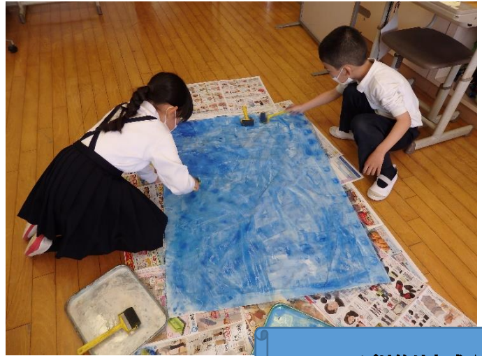
こいのぼり飾り完成☆