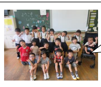
保育所の園児さんとの交流会の様子です★